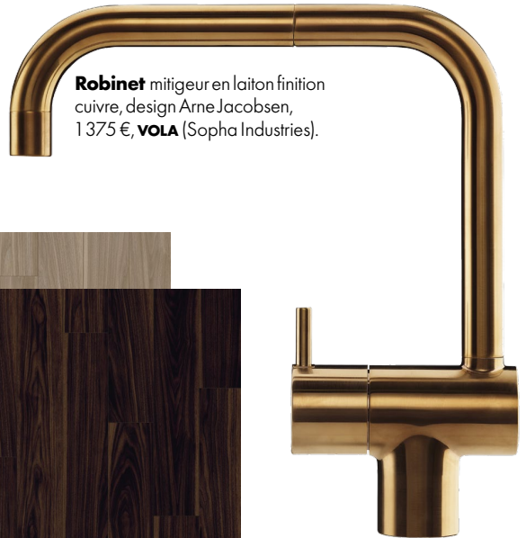
Robinet mitigeur en laiton finition cuivre, design Arne Jacobsen, 1 375 €, VOLA (Sopha Industries).