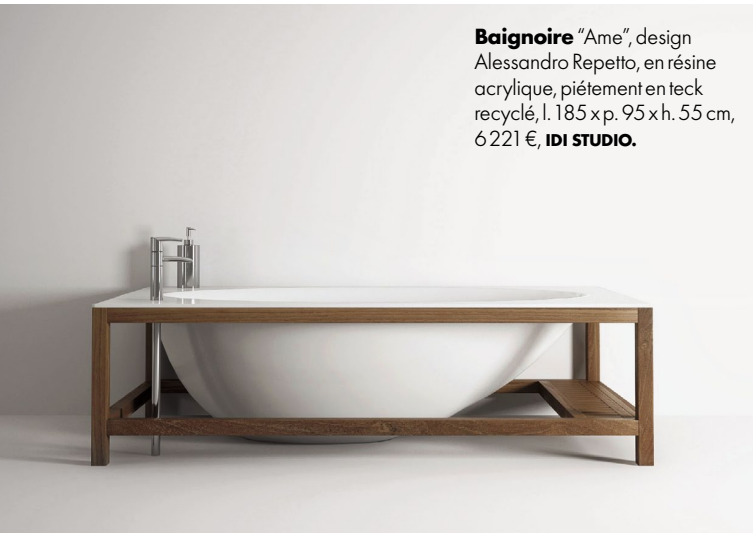
Baignoire "Ame" , design Alessandro Repetto, en résine acrylique, piétement en teck recyclé, l. 185 x p. 95 x h. 55 cm, 6 221 €, IDI STUDIO .