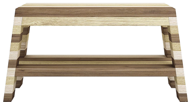
Banc en érable et noyer, collection Catino, design Emanuele Pangrazi, l. 100 x p. 50 x h. 49,50 cm, prix sur demande, DISEGNO CERAMICA .