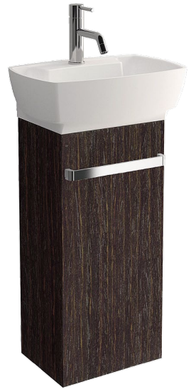
Lave-mains "Eos" plaqué chêne, large poignée chromée, l. 40 x p. 27 x h. 73 cm, 588 €, DECOTEC .