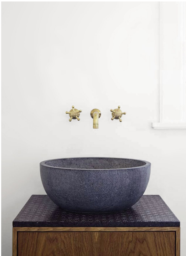
Vasque à poser en pierre de lave lisse, "Lava Nuda", l. 46 x p. 36 x h. 18 cm, 3 000 €, MADE A MANO .